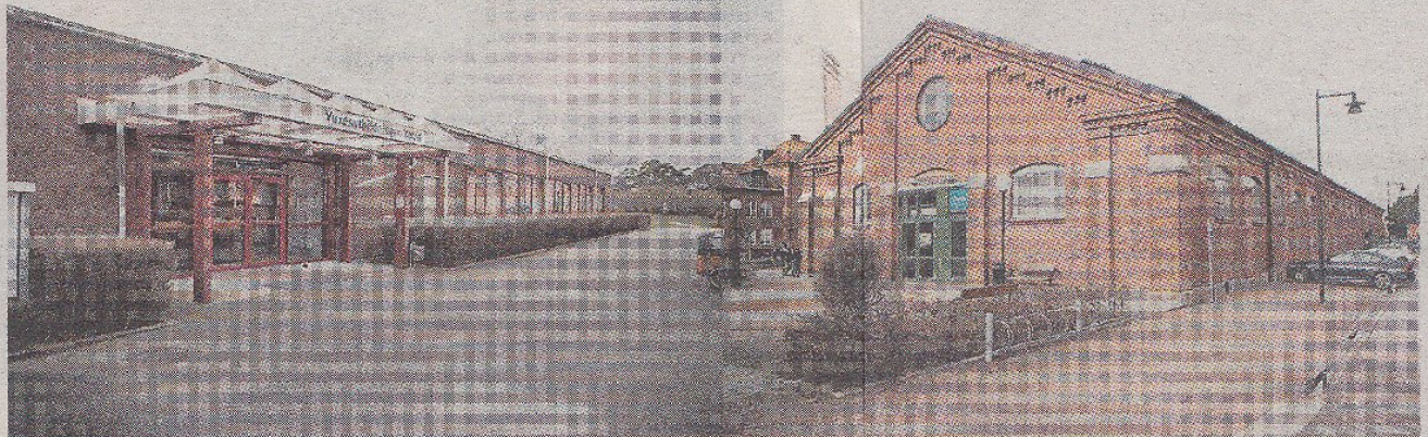
Byggnader på regementet.