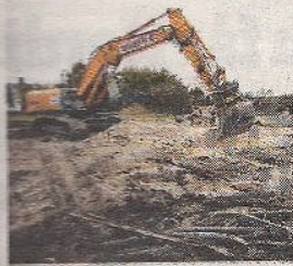
Rivning av husen i Revhusen.

Ystads museichef Sebastian Goksör skriver att nybyggnationerna i stor omfattning påverkar kvarterets unika karaktär. "I synnerhet husens höjd på upp till 16,5 meter... omöjliggör att bevara den sublima geometriska karaktären" av de gamla byggnaderna. (Yttrande 2020-04-20).